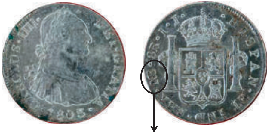
Moneda Española, de Ocho Reales, Acuñada por Orden del Rey Carlos IV, en la Casa de la Moneda de la Ciudad de Lima, en 1803. Moneda Tipo I.3. 13