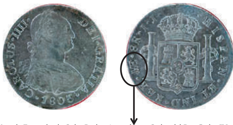
Moneda Española, de Ocho Reales, Acuñada por Orden del Rey Carlos IV, en la Casa de la Moneda de la Ciudad de Lima, en 1803. Moneda Tipo I.1. 3

En cambio, el tesoro contenido en las bodegas de la Fragata Mercedes ha permanecido bajo el mar por más de 200 años, hasta que la empresa norteamericana Odyssey, sin permiso del Reino de España, lo sacó del fondo del mar.