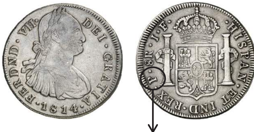
Moneda española, de Ocho Reales, acuñada por orden del Rey Fernando VII, en la Casa de la Moneda de la ciudad de Popayán, en 1814. 47

En América nacieron nuevas cecas para cubrir las necesidades circulatorias: Guanajuato, Durango, Guadalajara, Sombrerete, Tlapujahua, Oaxaca, Nueva Vizcaya, Caracas, Valladolid de Michoacán, Cusco... Sus tipos fueron muy variados, a veces con bustos imaginarios de Fernando VII, escudos de las ciudades, águilas, arcos y flechas... Muchas fueron de pobre fabricación y a veces se hizo figurar su carácter de “moneda provisional”. 48