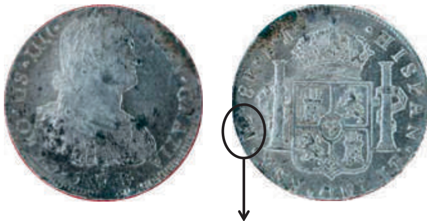
Moneda Española, de Ocho Reales, Acuñada por Orden del Rey Carlos IV, en la Casa de la Moneda de la Ciudad de Lima, en 1803. Moneda Tipo I.2. 6