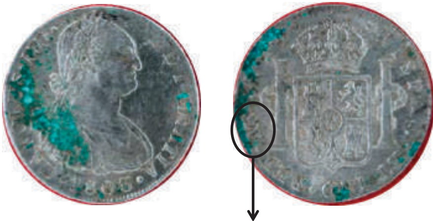
Moneda Española, de Ocho Reales, Acuñada por Orden del Rey Carlos IV, en la Casa de la Moneda de la Ciudad de Lima, en 1803. Moneda Tipo II.1. 16

Sin embargo, el Perú ha invocado dicho tratado en este litigio en Tampa, U.S.A., así como en la Controversia Internacional seguida ante el Tribunal de La Haya contra la República de Chile, por los límites marítimos entre ambos países.