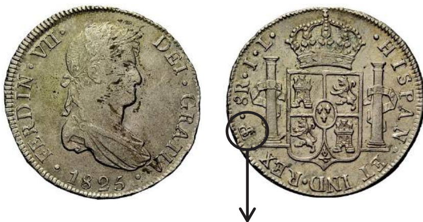
Moneda de España, de Ocho Reales, acuñada por orden del Rey Fernando VII, en la Casa de la Moneda de la ciudad de Potosí, en 1825. 72

Y finalmente, tenemos las monedas acuñadas en Lima y Cusco, donde reiteramos que son monedas españolas y no de la República del Perú.