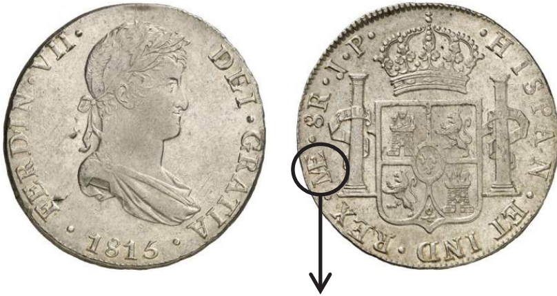
Moneda española, de Ocho Reales, acuñada por orden del Rey Fernando VII, en la Casa de la Moneda de la ciudad de Lima, en 1815. 52

Consecuencia: los objetos que se encuentren en cada uno de los países, respectivamente, serán suyos.