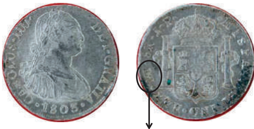
Moneda Española, de Ocho Reales, Acuñada por Orden del Rey Carlos IV, en la Casa de la Moneda de la Ciudad de Lima, en 1803. Moneda Tipo II.2. 17

Es interesante mencionar que en este Documento, España distingue entre “Spanish” y “Spain”.