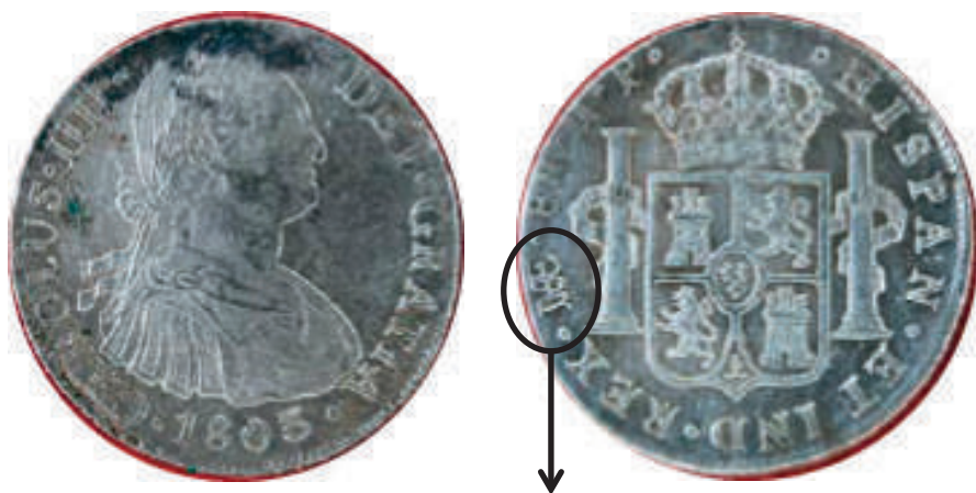
Moneda Española, de Ocho Reales, Acuñada por Orden del Rey Carlos IV, en la Casa de la Moneda de la Ciudad de Lima, en 1803. Moneda Tipo II.3. 18

El 6 de febrero de 2009, la Sociedad Numismática del Perú, presidida y representada por el autor, ofreció su ayuda al Ministerio de Relaciones Exteriores del Perú, de lo que se puede apreciar en los Anexos 2 y 3 que se presentan en este libro. La verdad es que no hubo mayor interés de las autoridades.