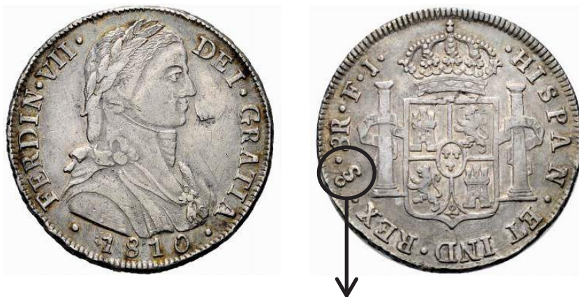
Moneda española, de Ocho Reales, acuñada por orden del Rey Fernando VII, en la Casa de la Moneda de la ciudad de Santiago, en 1810. 37