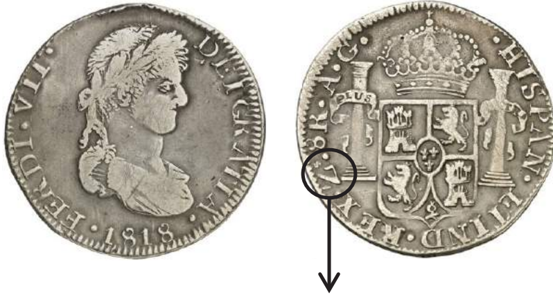
Moneda española, de Ocho Reales, acuñada por orden del Rey Fernando VII, en la Casa de la Moneda de la ciudad de Zacatecas, en 1818. 64