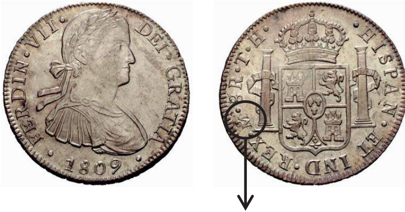
Moneda española, de Ocho Reales, acuñada por orden del Rey Fernando VII, en la Casa de la Moneda de la ciudad de México, en 1809. 30