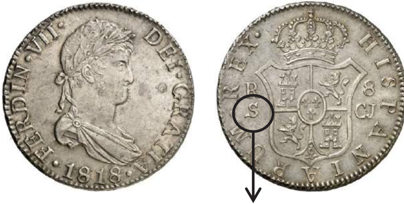
Moneda española, de Ocho Reales, acuñada por orden del Rey Fernando VII, en la Casa de la Moneda de la ciudad de Sevilla, en 1818. 58

Inclusive, se llega al extremo, si esa moneda se trae al Perú, luego ya no se podrá sacar. 57