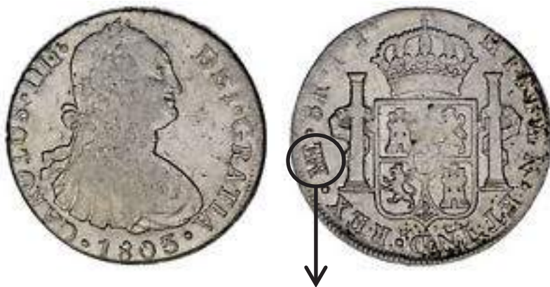
Moneda Española, de Ocho Reales, Acuñada por Orden del Rey Carlos IV, en la Casa de la Moneda de la Ciudad de Lima, en 1803. 73

Una posición extrema nacionalista, en nuestra opinión equivocada, es la que sustenta Pedro de la Puente, actual Presidente de la Sociedad Numismática del Perú, quien defiende la tesis de que las monedas acuñadas en la Casa de Moneda de Lima, durante el Virreinato del Perú, son de la República del Perú, y no del Reino de España. En efecto, él señala: