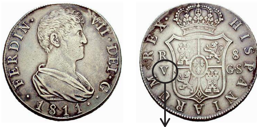
Moneda española, de Ocho Reales, acuñada por orden del Rey Fernando VII, en la Casa de la Moneda de la ciudad de Valencia, en 1811. 40

e independiente. Proceso independentista que quedó consolidado en 1824.